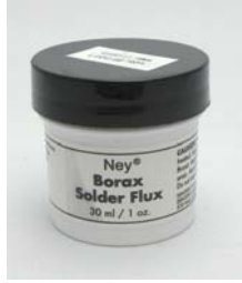
ロウ着用フラックス