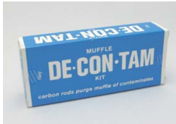
マッフル汚染防止用炭素棒