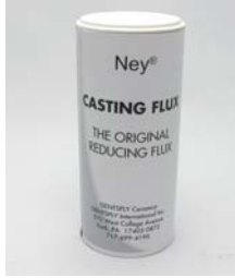
鑄造用フラックス