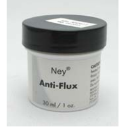
流ロウ防止用フラックス