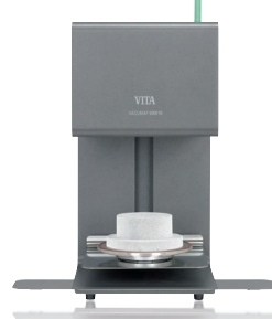
ポーセレンファーンエス パキユマット6000M

■仕様 寸法/大きさ ・幅：230mm ・奥行：330mm ・高さ：440mm ・重量：18kg ・炉内の内径：90mm、高さ 55mm ・炉内の温度：最高 1200℃ 電気仕様 ・電源電圧：AC100V 50/60Hz ・消費電力：最大 1500W