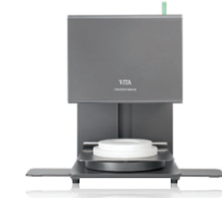
ジルコニア シンタリング焼成ファーンエス ジルコマット6000MS

■仕様 寸法/大きさ ・幅：315mm ・奥行：500mm ・高さ：470mm ・重量：27kg ・炉内の内径：90mm、高さ 70mm ・炉内の温度：最高 1600℃ 電気仕様 ・電源電圧：200V 50/60Hz ・消費電力：最大 1450W