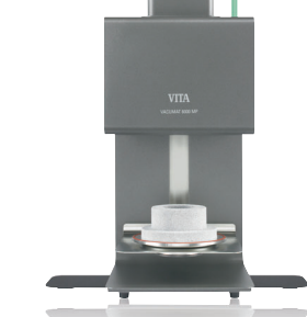
プレスファーンエス パキユマット6000MP

■仕様 寸法/大きさ ・幅：230mm ・奥行：325mm ・高さ：630mm ・重量：20.1kg ・炉内の内径：90mm、高さ 55mm ・炉内の温度：最高 1200℃ 電気仕様 ・電源電圧：AC100V 50/60Hz ・消費電力：最大 1500W