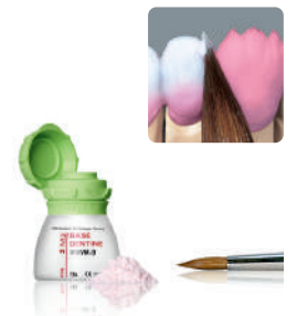
ジルコニア・セラミック陶材