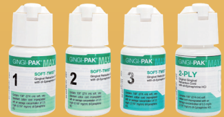
Φ0.6mm Φ1.4mm Φ1.6mm Φ1.7mm

期間中、ジンジパックコード1瓶に同サイズのジンジパックコード1瓶をセットにし、特別価格にてご提供いたします。