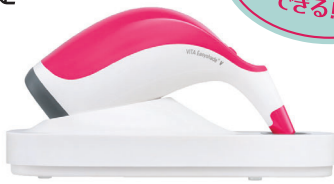
ビタ イージーシェードV