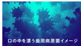
口の中を漂う歯周病原菌イメージ

歯周病原菌が存在すると 進行促進の可能性が高くなります。 バナペリオは、歯周病の進行に最も関係ある レッドコンプレックスという菌群を調べます。