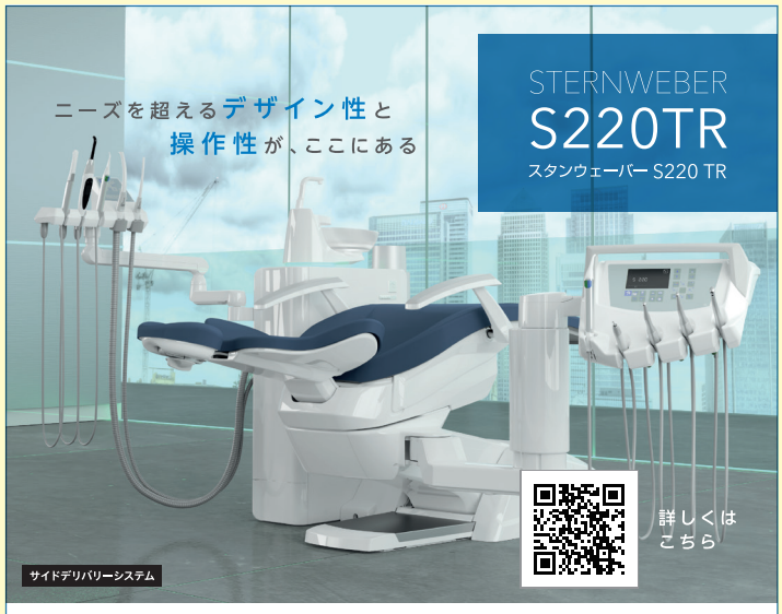
サイドデリバリーシステム