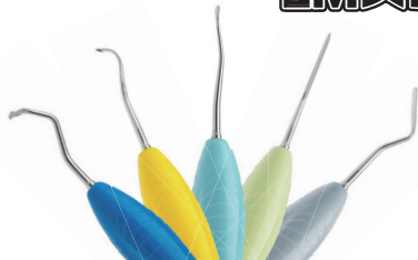
LM マイクロサージカルインスツルメント (5 本)