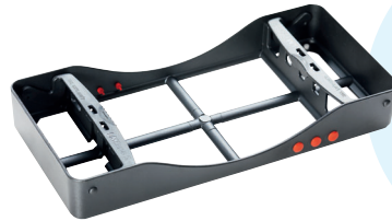
LM インスツルメントカセット 5 本用