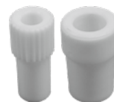
変換アダプター 2個